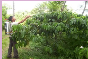
Penyemprotan pada tanaman kopi

mulai dari ukuran buah 9 – 12 cm dan pada daun muda untuk serangan kepik penghisap buah ( Helopeltis sp)