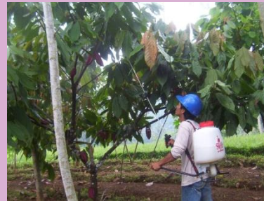
Penyemprotan pada tanaman kakao